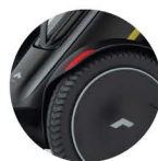
Rückstrahler (x 2)