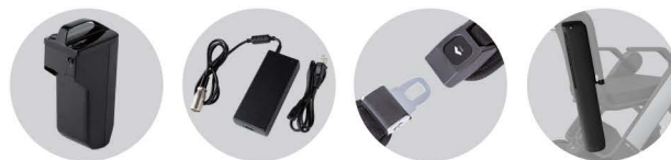
Akku Akkuladegerät Beckengurt Stock-Halter